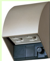
Champagne Bronze シャンパンブロンズ