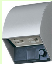
White Silver ホワイトシルバー